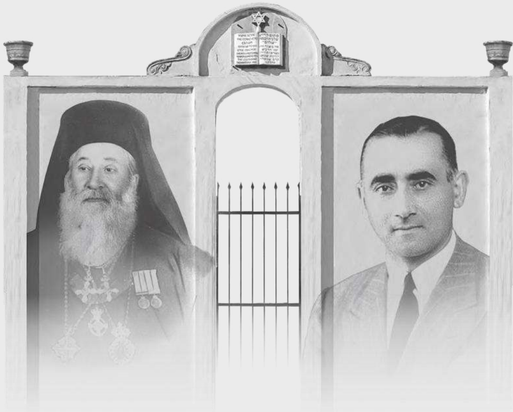
ΜΗΤΡΟΠΟΛΙΤΗΣ ΧΡΥΣΟΣΤΟΜΟΣ ΔΗΜΗΤΡΙΟΥ